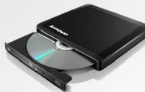
Gravador de DVD USB portátil Lenovo