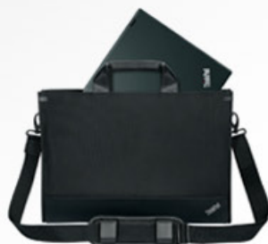
Maleta para Ultrabook (X1 carbon e T430u)