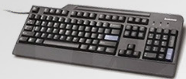
Teclado Lenovo padrão BR Preferred Pro USB