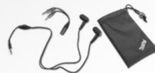
Fones de ouvido com microfone ThinkPad