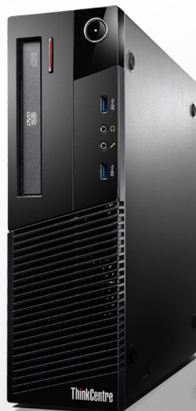
Imagem meramente ilustrativa 1

Desktop Premium mais confiável do mercado. O Desktop M93p possui alto desempenho para usuários que buscam um equipamento seguro, com flexibilidade na configuração e opções avançadas de gerenciamento.