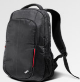
Mochila Básica Preta Heróica