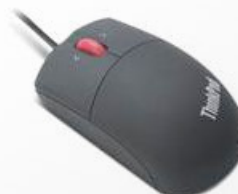
Mouse Óptico (USB) Lenovo