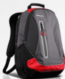
Mochila Sport Lenovo