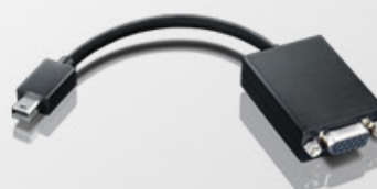
Cabo Adaptador Mini DisplayPort para VGA