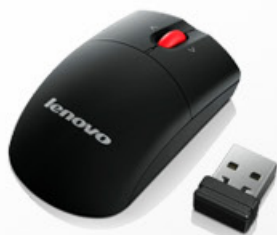
Mini Mouse sem fio com microrreceptor (inclui pilhas)