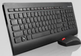
Teclado e mouse wireless ultraslim Lenovo