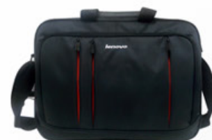
Maleta Básica Lenovo