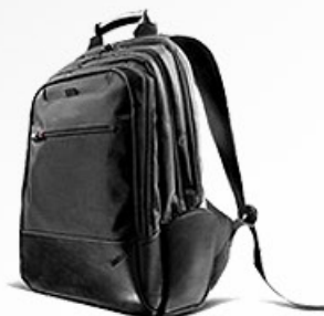
Mochila Executiva Lenovo