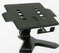
Suporte para notebook essencial Lenovo