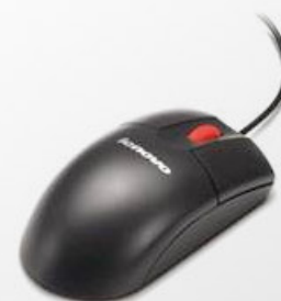
Mouse Lenovo Óptico 400dpi com Wheel - USB