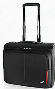
Mochila Roller ThinkPad PN 7BY2375