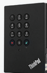
HD Externo USB Criptografado 750GB PN 0A65616