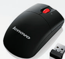
Mini Mouse sem fio com microrreceptor (inclui pilhas) PN 0A36188