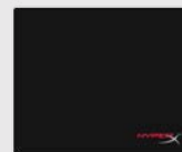
M: 300 mm x 360 mm