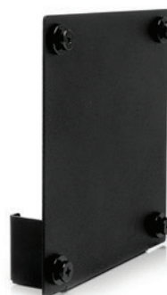
Suporte de VESA para o Monitor Local E2003b PN 4Z40J30272