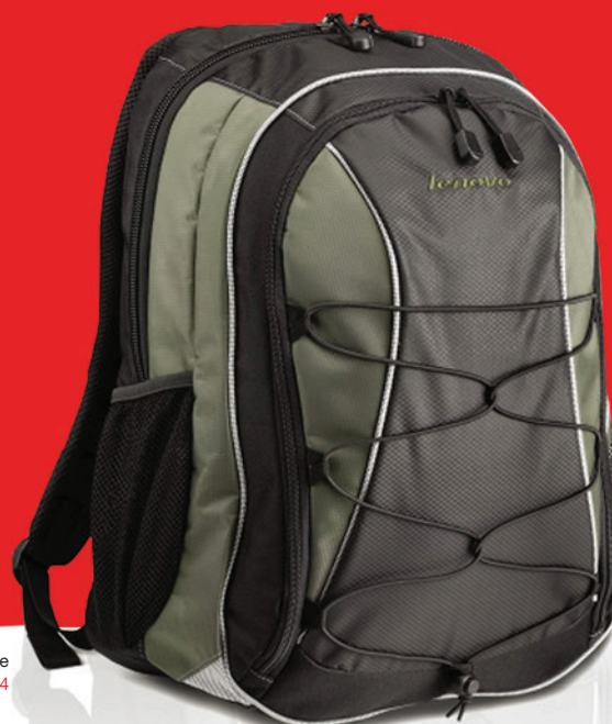
Mochila Performance PN 41U5254

Para conhecer melhor nossos acessórios e compatibilidade acesse: LENOVOQUICKPICK.COM/BRA