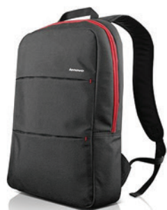
Mochila Basic PN 0B47304