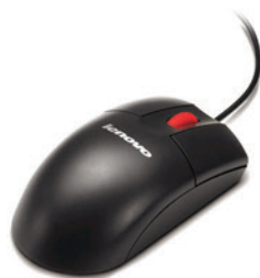
Mouse Optico 400dpi com Wheel USB PN 06P4069