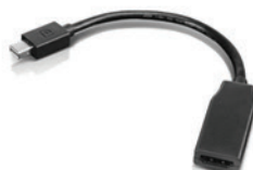
Cabo Adaptador Mini DisplayPort para HDMI PN 0B47089