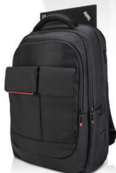
Mochila Profissional PN 4X40E77324