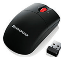
Mouse Wireless PN 4X30G97579