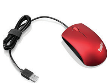
Mini-Mouse Optico 800dpi - 3 Botões USB PN 31P7410