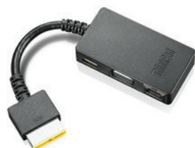
Adaptador Onelink PN 4X90G85927