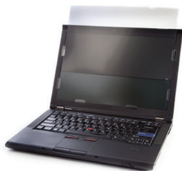
Filtro de privacidade para 14W PN 0A61769