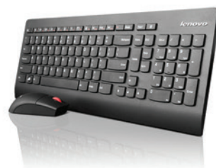
Teclado e Mouse sem fio Ultrathin (sem pilhas) PN 0A34070