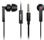
Fone de ouvido in-EAR com Microfone PN 4XD0J65079