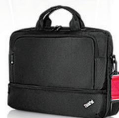
Maleta Essencial PN 4X40E77328