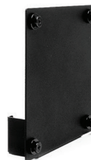
Suporte de VESA para o Monitor Local F2231p PN 4ZF0L14655

©2015 Lenovo. Todos os direitos reservados. Disponibilidade: Ofertas, preços, especificações e disponibilidade podem mudar sem aviso prévio. A Lenovo não se responsabiliza por erros fotográficos ou tipográficos. Garantia: Para obter uma cópia das garantias aplicáveis, escreva para: Informação de garantia, 500 Park Offices Drive, RTP, NC, 27709, Attn: Dept. ZPYA/B600. A Lenovo não representa ou possui garantia de produtos ou serviços de terceiros. Marcas registradas: Lenovo, o logo Lenovo, Rescue and Recovery, ThinkStation, ThinkVantage e ThinkVision são marcas registradas ou marcas comerciais da Lenovo. Microsoft, Windows e Vista são marcas registradas da Microsoft Corporation. Intel, o logotipo Intel, Intel Inside, Intel Core e Core Inside são marcas da Intel Corporation nos EUA e em outros países. Outras companhias, nomes de produtos e serviços podem ser marcas registradas ou marcas de serviços de terceiros. Duração das baterias (e tempo de recarga) variam de acordo com muitos fatores incluindo configurações do sistema e utilização. Visite Lenovo.com/safecomputing periodicamente para obter as últimas informações sobre segurança e eficiência em computação.