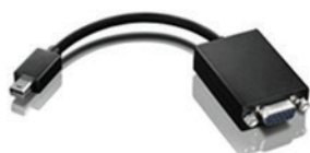
Cabo Adaptador Mini DisplayPort para VGA PN 0A36536