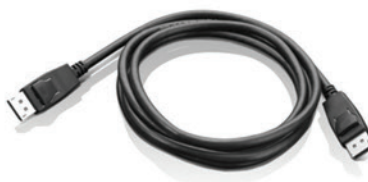
Cabo DisplayPort para DisplayPort PN 0A36537