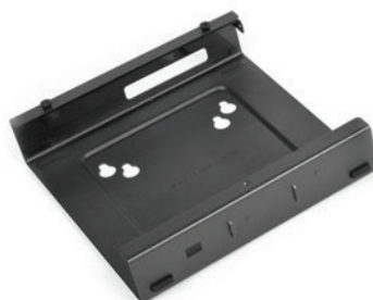
Suporte ThinkCentre Tiny VESA Mount PN 0B47374