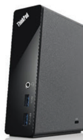
Dock USB 3.0 (Adaptador AC Brasil) PN 4X10A06695