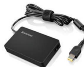
AC Adapter 65W (slim tip) PN 0A36260