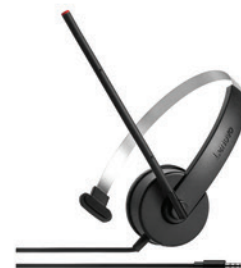
Fone de ouvido Mono Analog PN 4XD0K25028