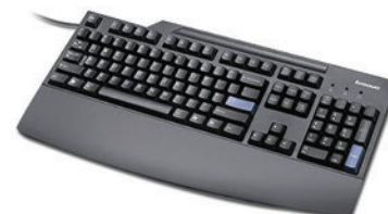
Teclado Preferred Pro Full-size USB - Português-Brasil PN 73P5258