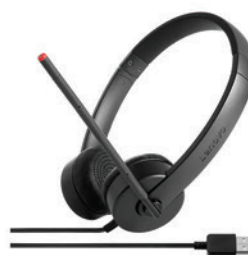
Fone de ouvido Stereo USB PN 4XD0K25031