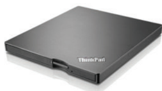
DVD Burner portátil USB PN 4XA0E97775