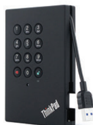
HD Portátil 1TB USB 3.0 PN 0A65621