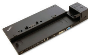
Dockstation Ultra 90 W PN 40A20090BR