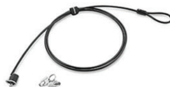
Cabo de Segurança PN 57Y4303