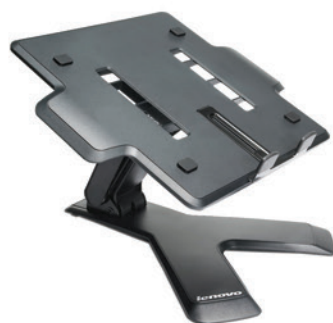
Suporte para Notebook Essential PN 45J9292