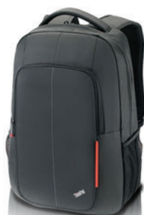
Mochila Essencial PN 4X40E77329