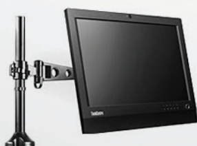
Braço extensor para All-in-One e Monitor PN 57Y4352

A Lenovo conta com um variado portfólio de acessórios, incluindo baterias, memórias, hds, dockstations, ac adapters entre outros. Para conhecer melhor nossos acessórios e compatibilidade acesse: