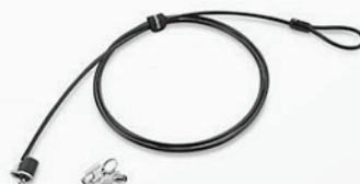
Cabo de Segurança PN 57Y4303