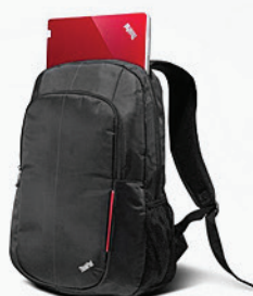
Mochila Essential PN 78Y2371