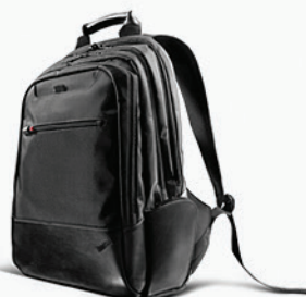
Mochila Executiva ThinkPad PN 43R24B2