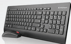
Teclado e Mouse sem fio Lenovo Ultralim PN 0A34070