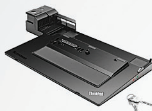
ThinkPad Mini Dock Séries 3 with USB 3.0 PN 433715P