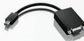
Cabo Adaptador Mini Display Port para VGA PN 0A36536