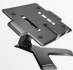
Suporte para Notebook Lenovo Essential PN 45J9292