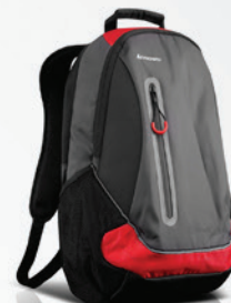
Mochila Sport Lenovo Vermelha PN 0A33896