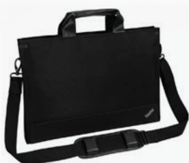
Maleta para Ultrabook PN 0B95750