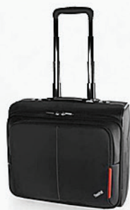
Mochila Roller ThinkPad PN 7BY2375