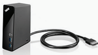
One Link Dock PN 4X10A06080