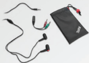
Fone de ouvido ThinkPad In-Ear com microfone PN 57Y4488