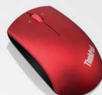
Mouse Wireless Vermelho PN 0B47165