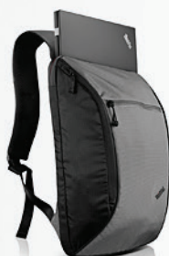
Mochila Ultralight PN 0B47306