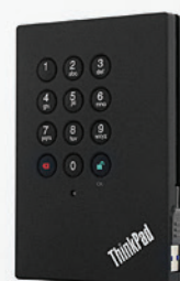
HD Externo USB Criptografado 750GB PN 0A65616