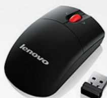
Mini Mouse sem fio com microrreceptor (inclui pilhas) PN 0A36188