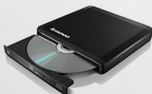
Gravador de DVD USB Lenovo PN z