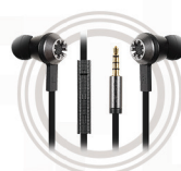
Fone intra-auricular Lenovo 500