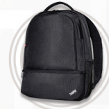
ThinkPad Essential BackPack