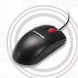
Mouse Lenovo Optico 400dpi com Wheel USB