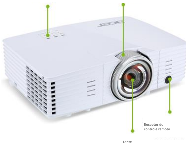
Ajuste de zoom