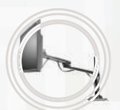
Suporte Lenovo™ com Ajuste de Altura