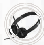
Headset Estéreo Lenovo™